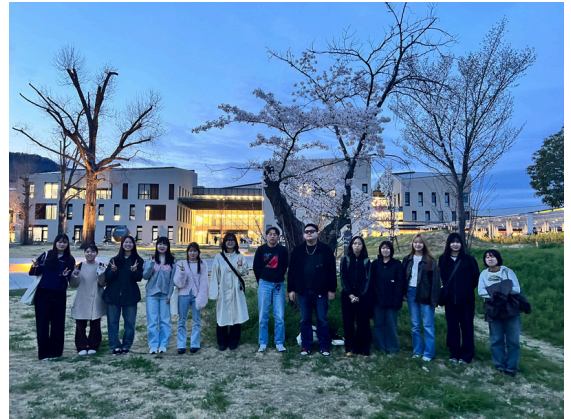
2026年4月9日 第一回ゼミ 大学生門にて

進級にあたり、今年度は築山ゼミ7期生8名を加えた計15名でぼたんを運営していきます。利用者様、オーナー様、そして地域の皆様とのつながりを大切にしながら、より多くの方に利用していただけるよう、新たなことにも挑戦していきたいと考えています。今年度もよろしくおねがいいたします。